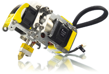
Extrudeur simple tête pour plastique 3.00mm