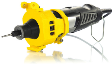
CNC DREMEL Tête de fraisage