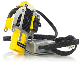
Module Laser Tête de découpe et gravure