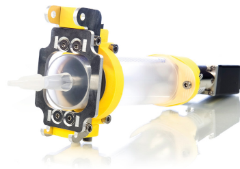
Extrudeur pour céramique et pâte épaisse