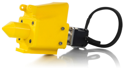
Extrudeur pour chocolat et pâtes alimentaires