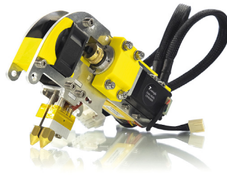
Extrudeur double tête pour plastique 1.75mm